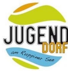
Gutshaus Gnewikow bei Neuruppin