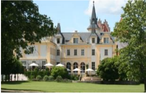
Schloss und Gut Liebenberg